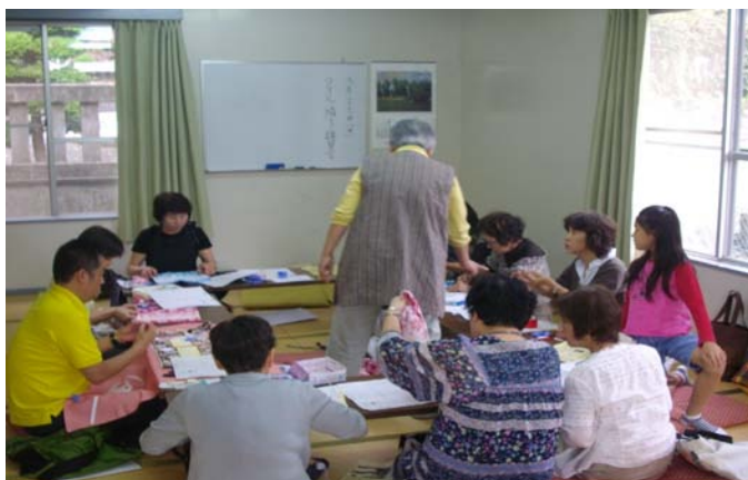
タオル帽子づくり講習会風景 公所自治会館にて 9.27(日)