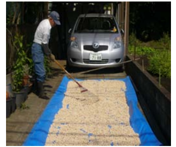
銀杏林の剪定風景(チップ作り) 天日干し風景